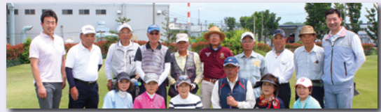
第3回平成杯パークゴルフ大会入賞された皆さんと