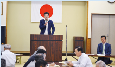
藤ノ木支部懇談会にて支部長挨拶