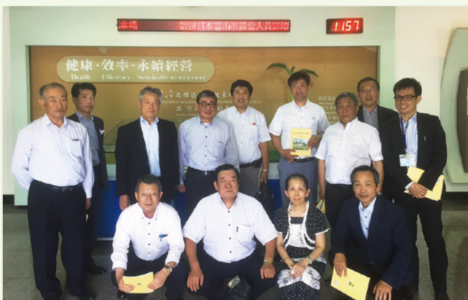
農業水産議連で高雄区農業改良場を訪問