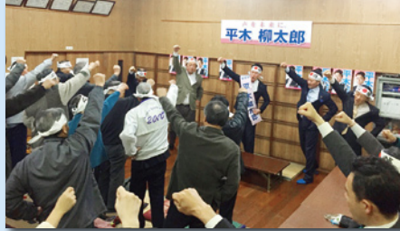
4月の県議会議員選挙にて同志を応援