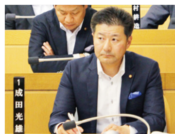
平成27年6月定例会議場にて

今回の4月12日の富山県議会議員選挙におきましては、富山第1選挙区で20歳から24歳までのいわゆる5歳年齢で見ますと、 17.63% 、25歳から29歳で 22.63% となっております。富山第2選挙区