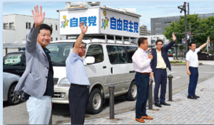
自民党富山市連遊説チームとして定例の街宣活動中