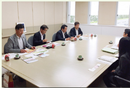
議会報視察として高崎市を訪問