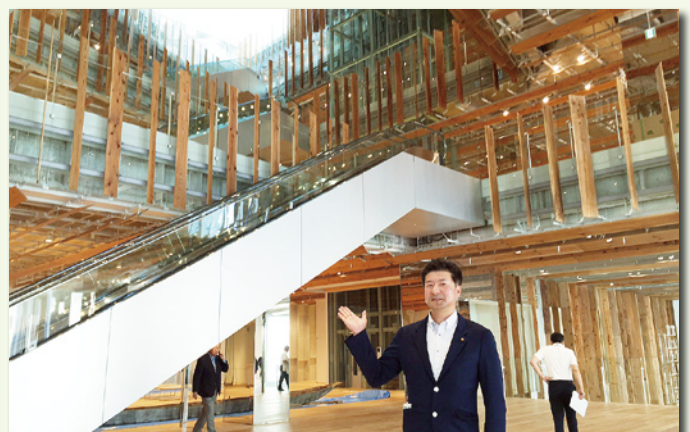
ガラス美術館と市立図書館本館が併設された TOYAMA キラリ