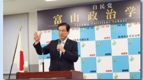
富山政治学校で政治家としての心構えを学ぶ