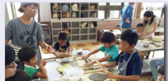
女性部主催による親子陶芸教室開催