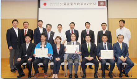
県連青年局政策コンテストにて