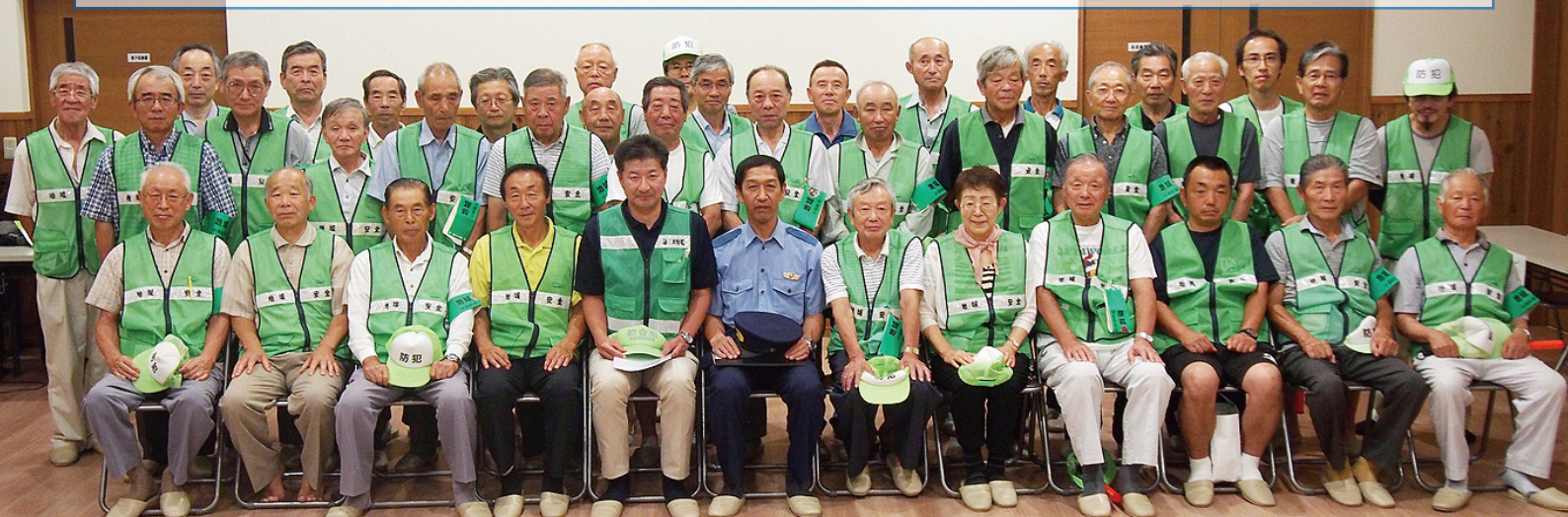
“自分たちのまちは 自分たちで守る” 中部防犯パトロール隊 夏期特別警戒出発式(平成27年7月20日)