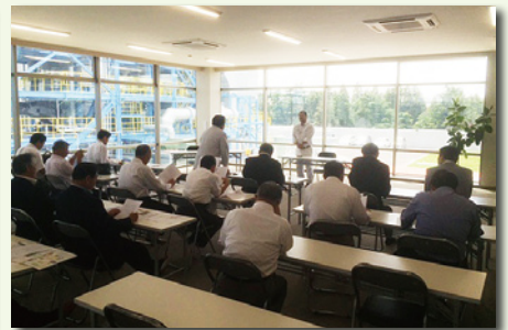
政調会視察研修としてバイオマス施設を訪問