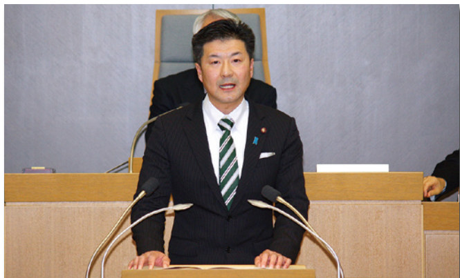
平成27年3月定例会一般質問に立つ

このような新幹線開業効果の一つとも言える状況を本市のシティプロモーションの絶好の機会として捉え、新たな地域創生につなげていきたいと考えている。