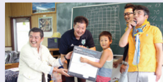
青年部主催による初夏のバーベキュー開催