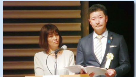
県連大会にて青年局として司会進行を担当