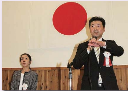
11月15日第3回定期総会及び市政報告会