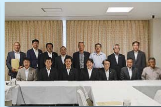
国防や安保について 小野寺元防衛大臣の講話（自民党本部）