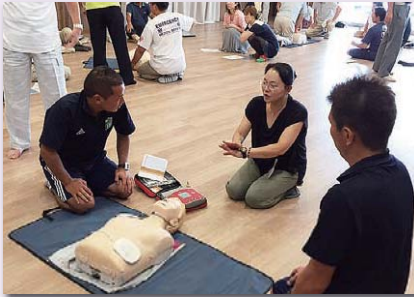
8月23日女性部主催によるAED講習会開催