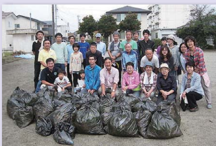
恒例の町内会環境美化活動に参加