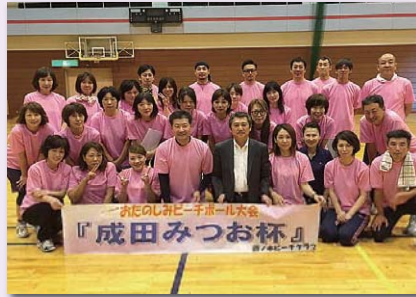
9月22日第2回ビーチボール大会開催（県総合体育館）