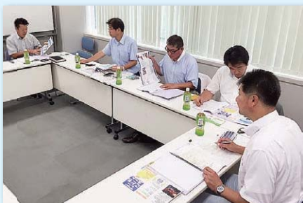
調布市の観光案内や地域振興について視察