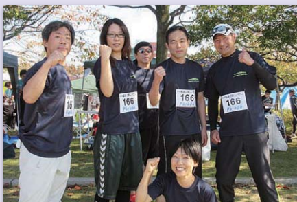
あいの風リレーマラソン2015にとやま自遊館チームとして参加