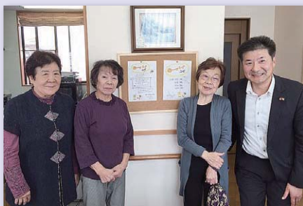
10月にオープンした憩いの場「オレンジカフェふじ」にて