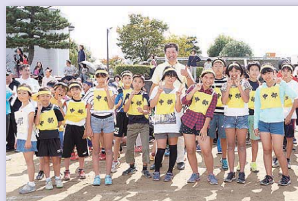
住民運動会にて小中学生リレーの選手たちと