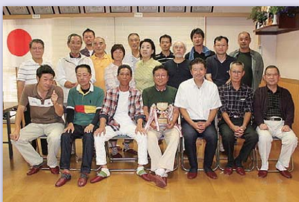
藤ノ木園町グリーン会ゴルフコンペに参加