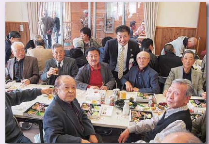
第3回定期総会及び懇親会