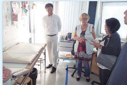
子育て家族支援ネウボラ施設を視察（ヘルシンキ）