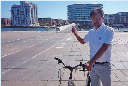
コペンハーゲン市の自転車優先のインフラ整備を視察