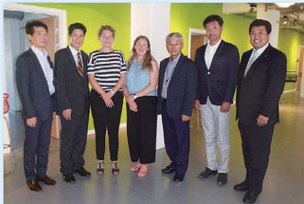
コペンハーゲン市の自転車施策について行政視察