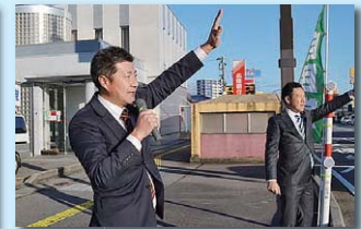
掛尾交差点にて朝の街宣活動