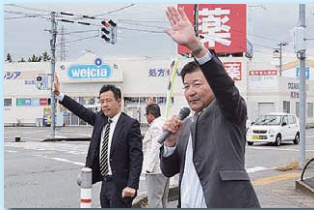
定例の街宣活動（天正寺地内）