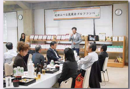
10月11日第2回ゴルフコンペ開催（富山CC）