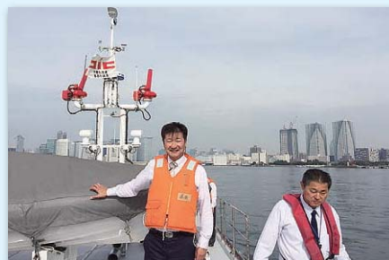
東京消防庁消防艇の乗船体験・視察