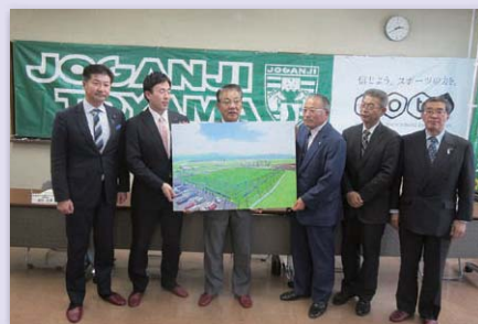
常願寺川公園SCスポーツパーク施設整備事業について報道発表