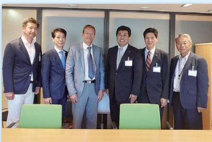
フィンランド国家教育制度について調査・視察（ヘルシンキ）