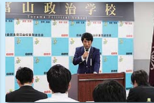
日本の財政と社会保障について田村憲久 元厚生労働大臣講話（富山政治学校）